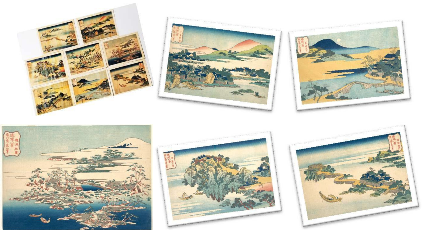
▲沖縄限定「琉球八景」シリーズは8種。／販売価格1枚500円(税込み、切手代込み)

その第一弾として、8月19日より「体験王国 むら咲むら」(沖縄県読谷村字高志保)にて、観光で沖縄を訪れた人が旅の思い出を自分宛や家族宛てに送る人気企画、“わたしだより”の沖縄限定版として、当商品の販売を開始します。